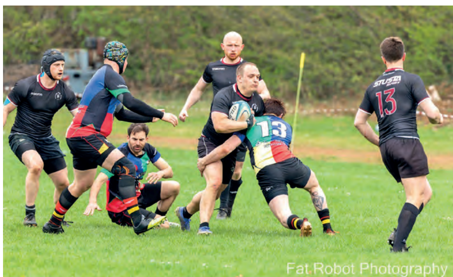
Fat Robot Photography

Die beiden Herren-Mannschaften der Rugby-Abteilung des TSV 1846 Nürnberg empfangen an diesem Doppelheimspieltag jeweils einen zähen Gegner aus dem unmittelbaren Tabellenfeld und das Ziel ist klar - die Punkte müssen in Nürnberg bleiben.