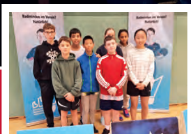
Badminton: Unsere U15 ist unschlagbar in Mittelfranken