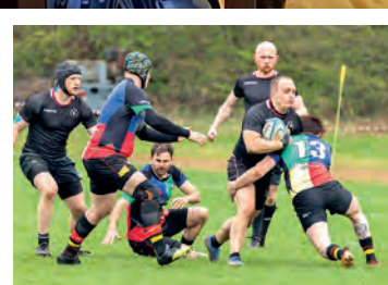
Rugby: harte Vorbereitung in der Winterpause