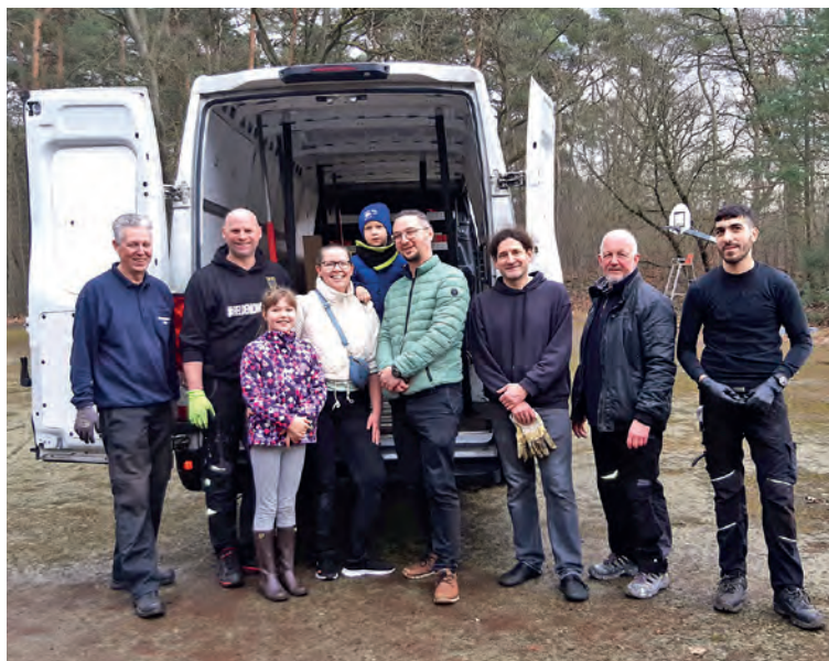
Teamwork beim Abbau der Eisbahn: v. li. Eiskunstlauf, Geschäftsstelle, Rollkunstlauf, Platzwart, Rugby